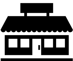
Foto von seinem Ladengeschäft

Bei mir finden sie ausgewählte und hochwertige Antiquitäten, Kunstwerke, Möbel, Gebrauchsgegenstände und Schmuck. Ich unterstütze Sie gerne mit meinem fachmännischen Rat bezüglich Pflege und Werterhaltung ihrer Objekte. Neben An- und Verkauf, biete ich auch einen professionellen Restaurierung- und Reparaturservice. Besuchen sie mich gerne in meinem Geschäft in der Gibsnicher Fußgängerzone.